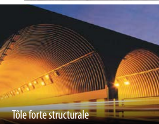
Tôle forte structurale