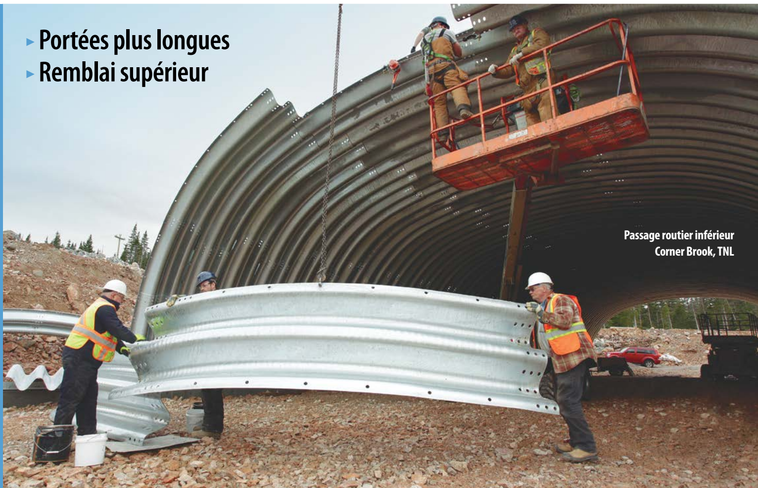
Passage routier inférieur Corner Brook, TNL