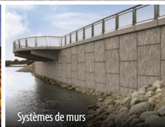
Systèmes de murs