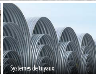
Systèmes de tuyaux